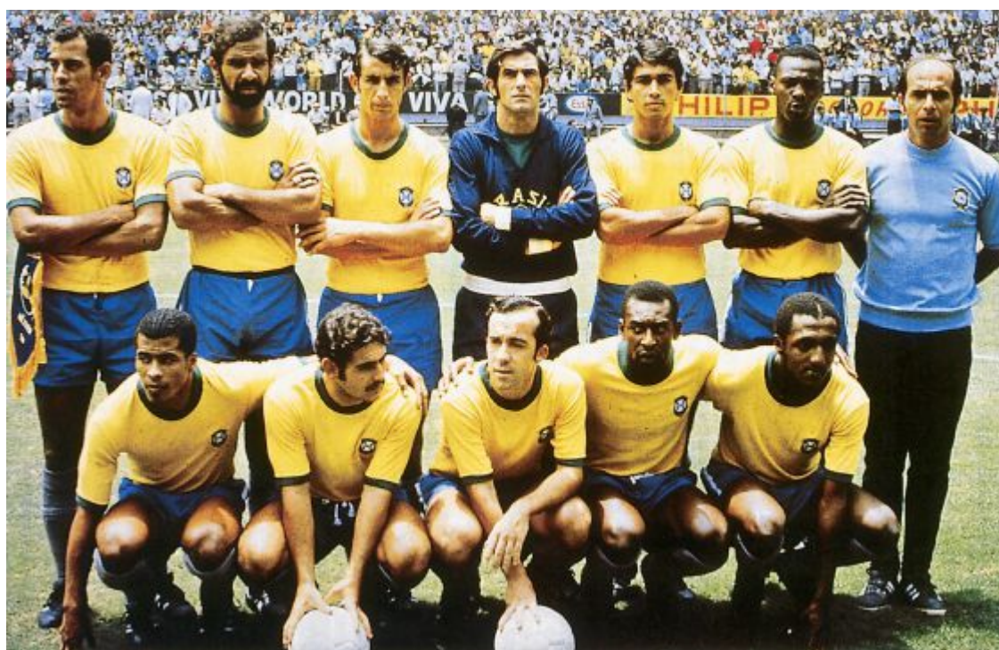
Brasilgo 1970eko selekzioa

Sekuentzia hau Difusion-hoy en clase sailetik hartu eta egokitu dugu.