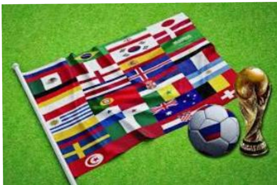
Errusia: 2018ko Munduko Futbol Txapelketa