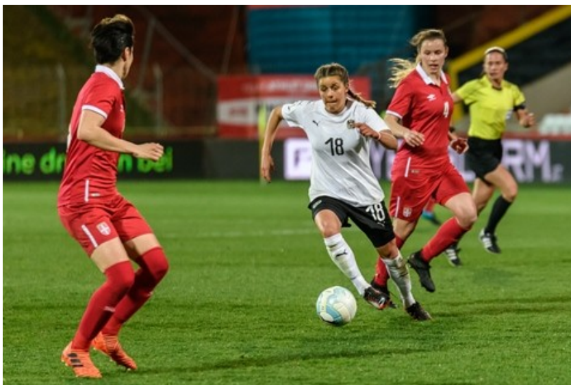
Emakumezkoen Munduko Futbol Kopa 2019an jokatuko da.

24 herrialdek soilik lortu dute edizioen batean munduko lau onenen artean sailkatzea. Talde horietatik 8 selekzio besterik ez dira izan munduko txapeldun: Brasil (5 aldiz), Alemania (4), Italia (4), Argentina (2), Uruguai (2), Frantzia, Ingalaterra eta Espainia (bana). Garaipen bakoitzeko herrialde horretako futbol-ezkutuari izar bat eransten zaio. FIFAk, Gizonezkoen Munduko Futbol Txapelketaz gain, Emakumezkoen Munduko Futbol-kopa ere antolatzen du: 1991n jokatu zen aurrenez, eta hurrengoa Frantzian izango da 2019an.