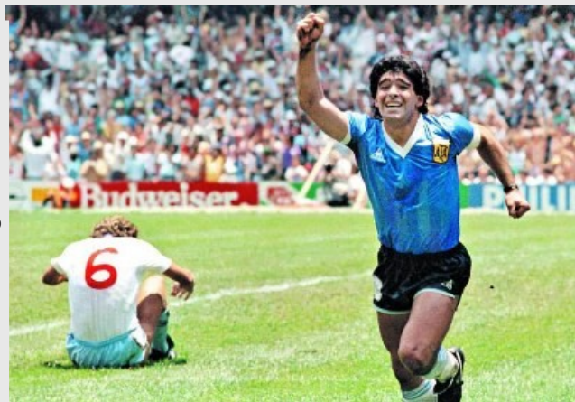
Maradona, gola ospatzen

Asiar kontinentean izan zen aurreneko Munduko Txapelketa 2002koa izan zen. Hego Koreak eta Japoniak elkarrekin antolatuta zuten. Eta berriro irabazi zuen Canarinhak, Ronaldo izar bihurturik. Japoniako Yokohama Nazioarteko Estadioan Brasil txapeldun izan zen bosgarren aldiz; aurten, Errusian, Alemania saiatuko da balentria hori berdintzen.