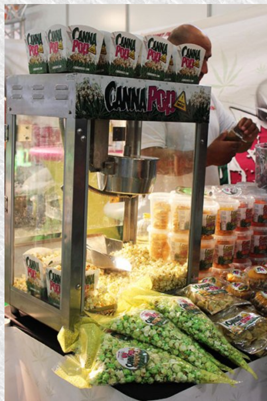
Kalamuarekin krispetak ere egin daitezke.

Nazioarteko medikuek kalamuak onura asko dituela esaten dute, eta zenbait gaixotasunetan lagun dezakeen ala ez ikertzen ari dira: alzhemerraren inguruan, fibromialgiaren inguruan... “Minbizia duten gaixoen artean, kimioterapiari aurre egiteko erabiltzen da: erreta edo infusio bezala, normalean. Kalamua ez da sendagai bat eta ez du xede hori, baina hainbat sendagairen osagarria izan daiteke”. Eta zuk zer uste duzu? Kalamuak gaixoei laguntzen diela? Indarrean dagoen arautegia ongi dagoela? Edo beste herrialderen batekoa ezagutzen duzu? Zer iruditzen zaizkizu kalamu-erabiltzaileen elkarteak?