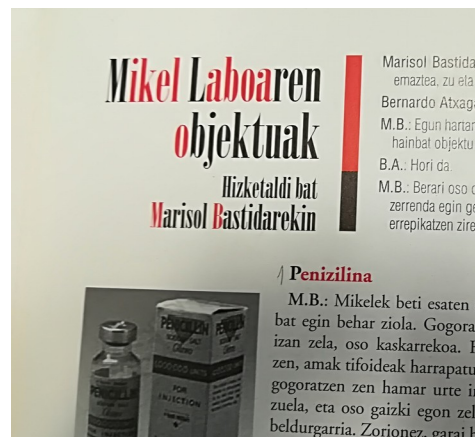
(Testua Erlea 1 aldizkaritik hartua eta moldatua)

M.B.: Liburu asko daude eta zaila da bat aukeratzea. Hala ere, nik uste dut autoreen artean Jean Piaget izan zela berak gehien maite zuena. Izugarri maite zuen. Baditugu etxean bere 7 liburu gutxienez. Denak zituen Mikel Laboak gustukoak, baina gehien erabiltzen zuena Epistemología genética zen. Nik uste dut Piagetek lan handia egin zuela haurren faseak aztertzen.