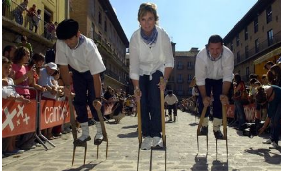
Laija lasterketa Artajonan