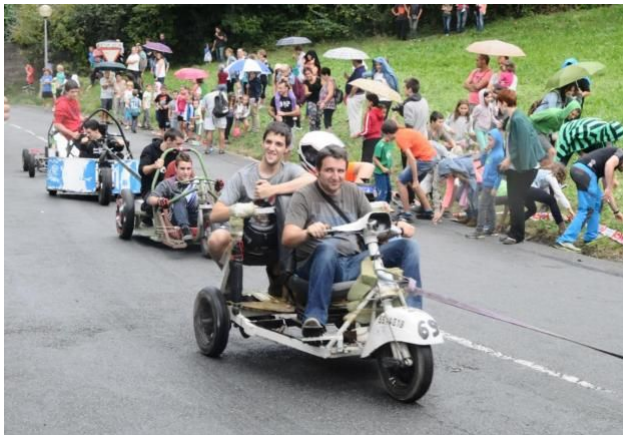
Goitibehera txapelketa Gaztelun