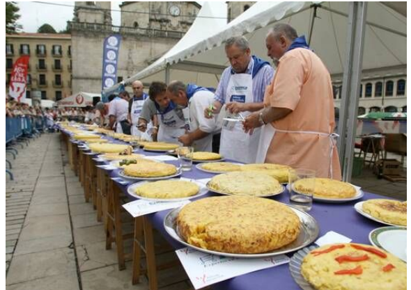
Bilboko tortilla txapelketa