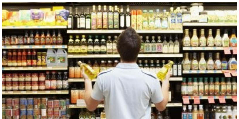
Supermerkatuek aukera handiagoa eskaintzen dute.

Oraingo produktuen eta denda-moten eskaintza oso handia da. Herri gehienetako kaleetan ditugu betiko merkatuak, harategiak, arrandegiak, urdaitegiak.... Supermerkatuak edo hipermerkatuak ere gertu samar egoten dira. Erosi nahi dugunaren eta erosketak egiteko dugun indarraren edo denboraren arabera nora jo aukeratzeko dugu. Hala ere, merkatuko azken ikerketen arabera, biztanleriaren %