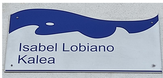
Irudia: Isabel Lobiano kalearen plaka Mutrikun. Egilea: Anitxu. Creative Commons (CC BY-SA 4.0)